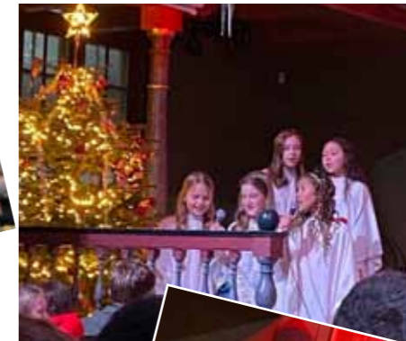
Tradisjonen tro var det julespel i Tysvær kyrkje på julaften. Her ser vi engleskaren, hyrdingane og dei vise menn i aksjon.