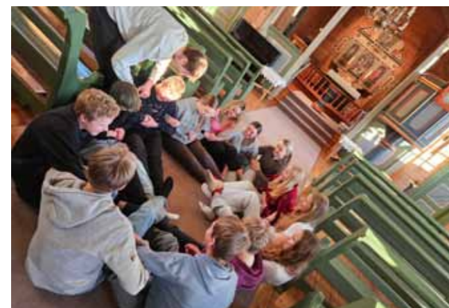
Samling for konfirmantane i Nedstrand kyrkje.