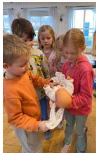
Årets dåpsskular er i gong. Her frå leik på dåpsskulan på Bokn.