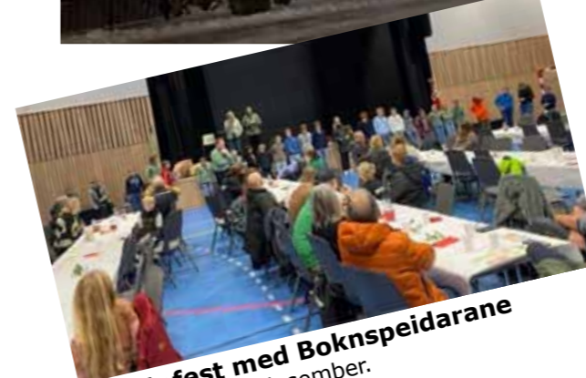
Grautefest med Boknspeidarane i Bokn arena, 5.desember.