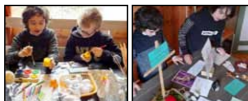
Arkivfoto: Frå Palmesøndagsskule i 2022

Du kan vera med på påskevandring, mala påskeegg eller anna påskeaktivitet og smaka på pannekakene. Bibelutstillinga vår står til palmesøndag. Har du ein bibel, gjerne gammal, så ta den gjerne med.