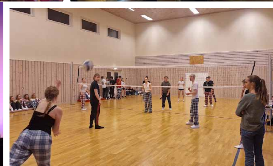
Ca 100 konfirmantar og 25 leiarar frå Bokn og heile Tysvær var samla til konfirmantleir på Brandøy , 26.-28.januar. Her er det nokre glimt frå ei flott helg.