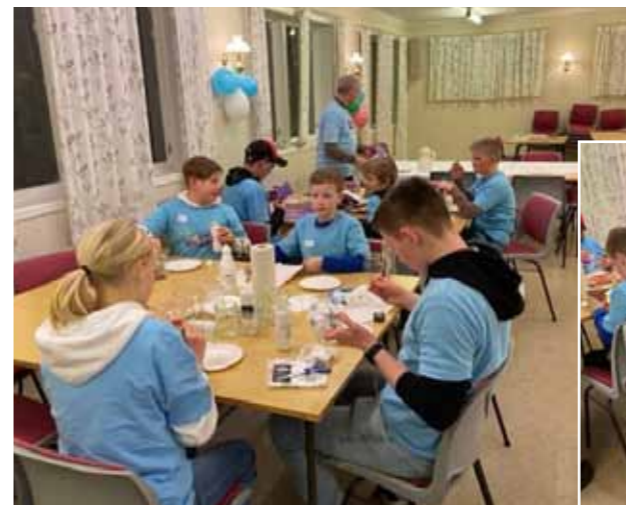
Slagordet «Kjekt på Bokn» stemte godt da det var Lys vaken på Bokn! Hobby, leik, mat og film var på Bedehuset. Resten av programmet var i kyrkja, der deltakarane faktisk sov i mange timar!