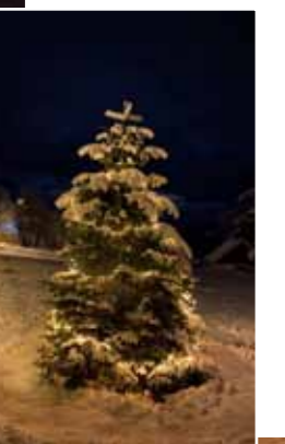
Lysmesse, fakkeltog og tenning av julegran 1. søndag i advent i Tysværavåg.