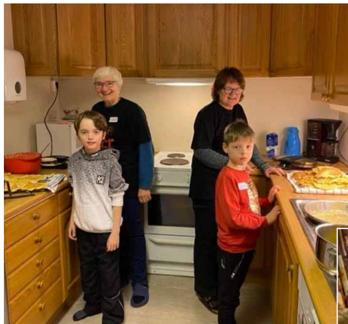
Det var kjempekjekt då ein fin gjeng med 3.klassingar inntok Tysvær soknehus om morgonen 22. januar.

Dagens tema var: «Kven er nesten min?» På føremiddagen var det samlingsstund, vaffelsteiking og hobbygrupper. Vi tok med oss eit stort lass med vaflar opp ein etasje for å møte ca 30 pensjonistar som hadde hatt dagens treningsøkt. Der framførte barna dramastykke om «Den barmhjertige samaritanen», og vi sang i lag.