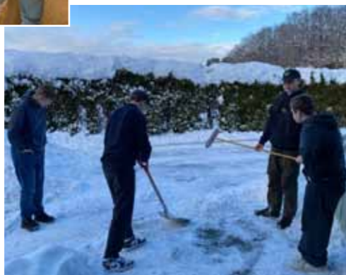
Dugnads-konfirmantar klargjer utanfor Tysvær soknehus før Supertorsdag.