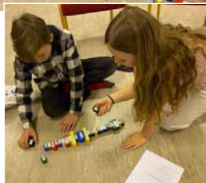
Bygging av tårn på 5. klassetreff i Tysvær Sokn.