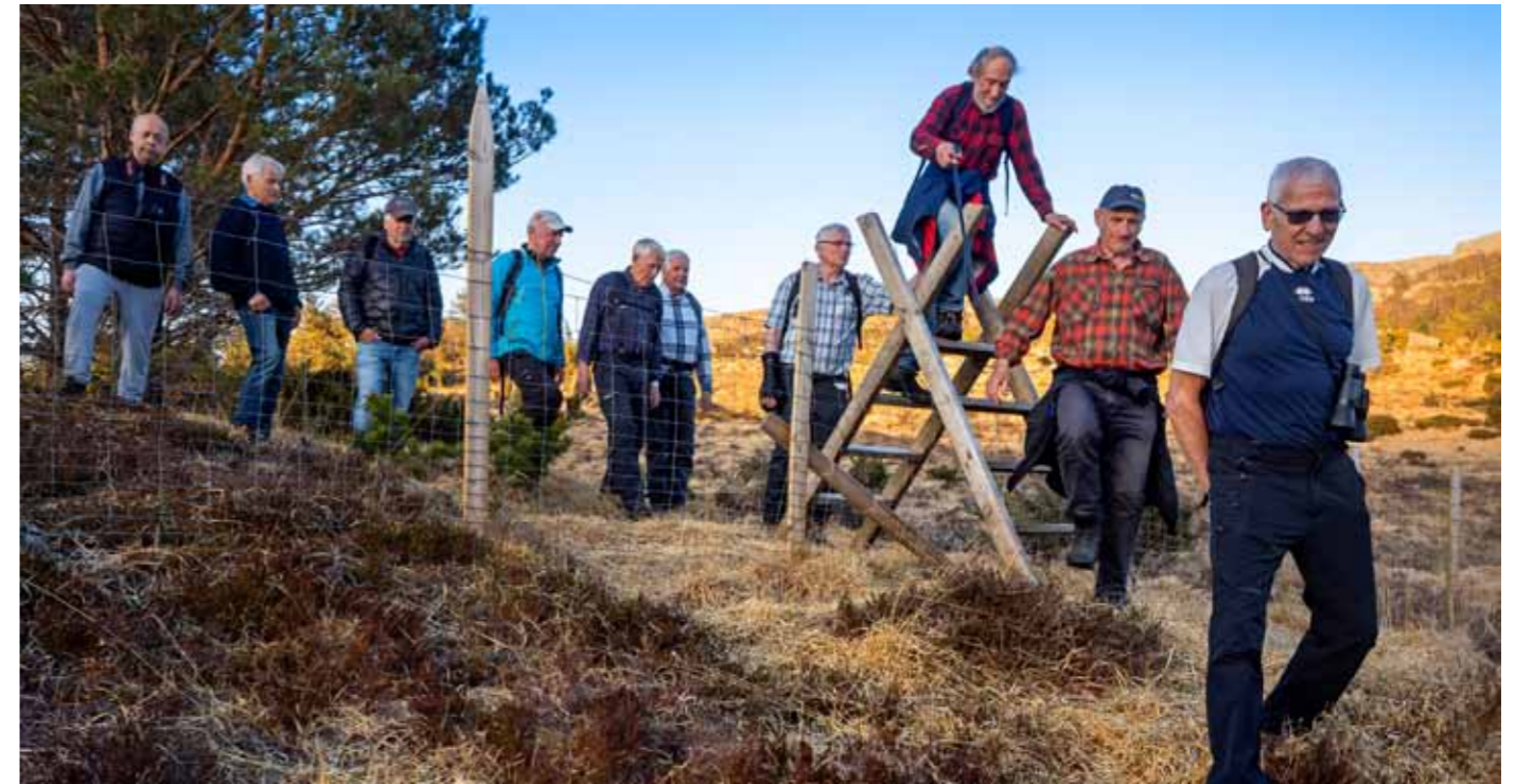
Bilde over: Mannsforeningen på historisk vandring til Morkjå ved Stakkestadvatnet.

Herren skal alltid lede deg og mette din sjel i det tørre landet. Han skal styrke kroppen din så du blir som en vannrik hage, en kilde der vannet aldri svikter.